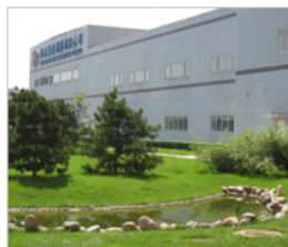
北京泰徳製薬股份有限公司

資本・業務提携 北京泰徳製薬股份有限公司 共同研究先 慶応義塾大学 聖マリアンナ医科大学 日本大学